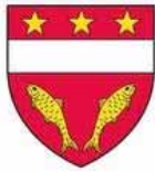
Syndicat Mixte pour le Sundgau

Le Syndicat Mixte pour le Sundgau à pour vocation de fédérer l'ensemble des partenaires locaux autour d'un projet commun de développement. Il regroupe le Schéma de Cohérence Territorial (Scot), le Pays du Sundgau et la compétence tourisme