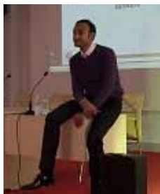
Atelier cci rennes