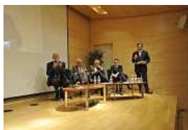
31 colloque CS3E

Le mardi 2 novembre 2010, se tenait le 31ème colloque de la CSEEE, Chambre Syndicale des Entreprises d'Équipement Électrique, auquel a été invité notre président et son secrétaire national.