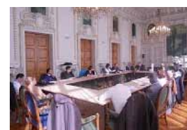
Conférence de presse lyon 7

Mardi 5 octobre 2010 l'OPMEC a participé à la conférence de presse organisée à la Mairie du 7ème arrondissement de Lyon, au cours de laquelle ont été