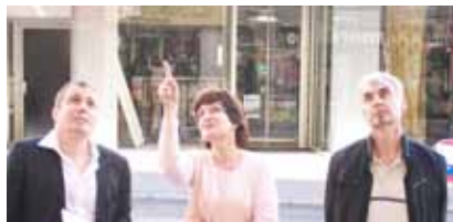
en pleine action sur Oullins...